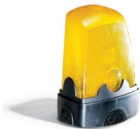
Signallampa - TILLVAL -