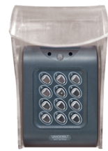
Kodlås - TILLVAL -