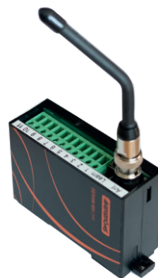
Easy handsändare - TILLVAL -