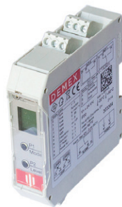
Easy fordonsdetektor - TILLVAL -