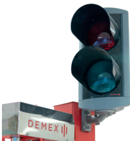
Trafikljus - TILLVAL -