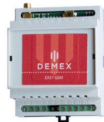
Easy GSM-Modul - TILLVAL -