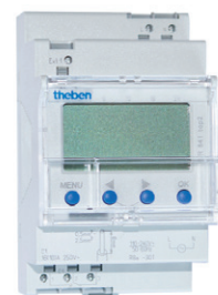
Tidsur - TILLVAL -