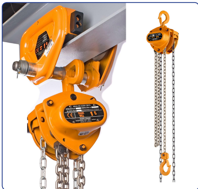
KITO Mighty CB

KITO Mighty snabblyftblock finns i kapaciteter från 500 kg till 50 ton. Den slagtåliga stålåpan kapslar in växelhuset och skyddar det mot fukt och damm. Med en hög teknisk nivå i tillverkningsprocessen garanteras ett lyftblock anpassat för krävande arbetsområden.