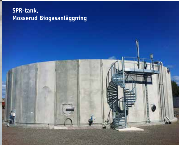
SPR-tank, Mosserud Biogasanläggning