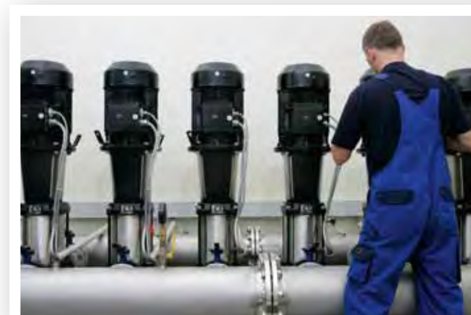
Satsa på ett serviceavtal från Grundfos och vi fixar jobbet!