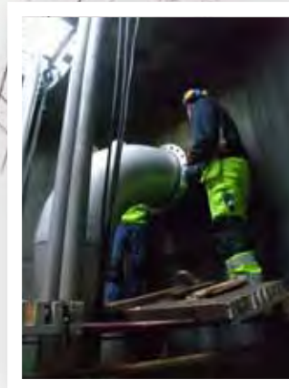
Utloppet monteras - snart dags för provkörning