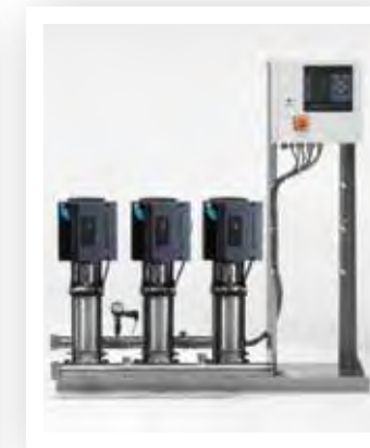
Kommunikation Grundfos Hydro MPC-E - Lon MPC-E - Profibus - Modbus - Comli - GSM/GPRS - BACnet