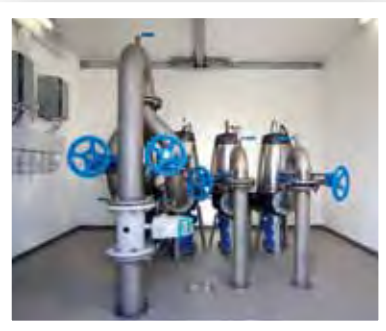
Torruppställd lösning med SE-pumpar - servicevänlig och ren miljö