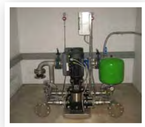
Smidig installation med Grundfos Hydro MPC-E