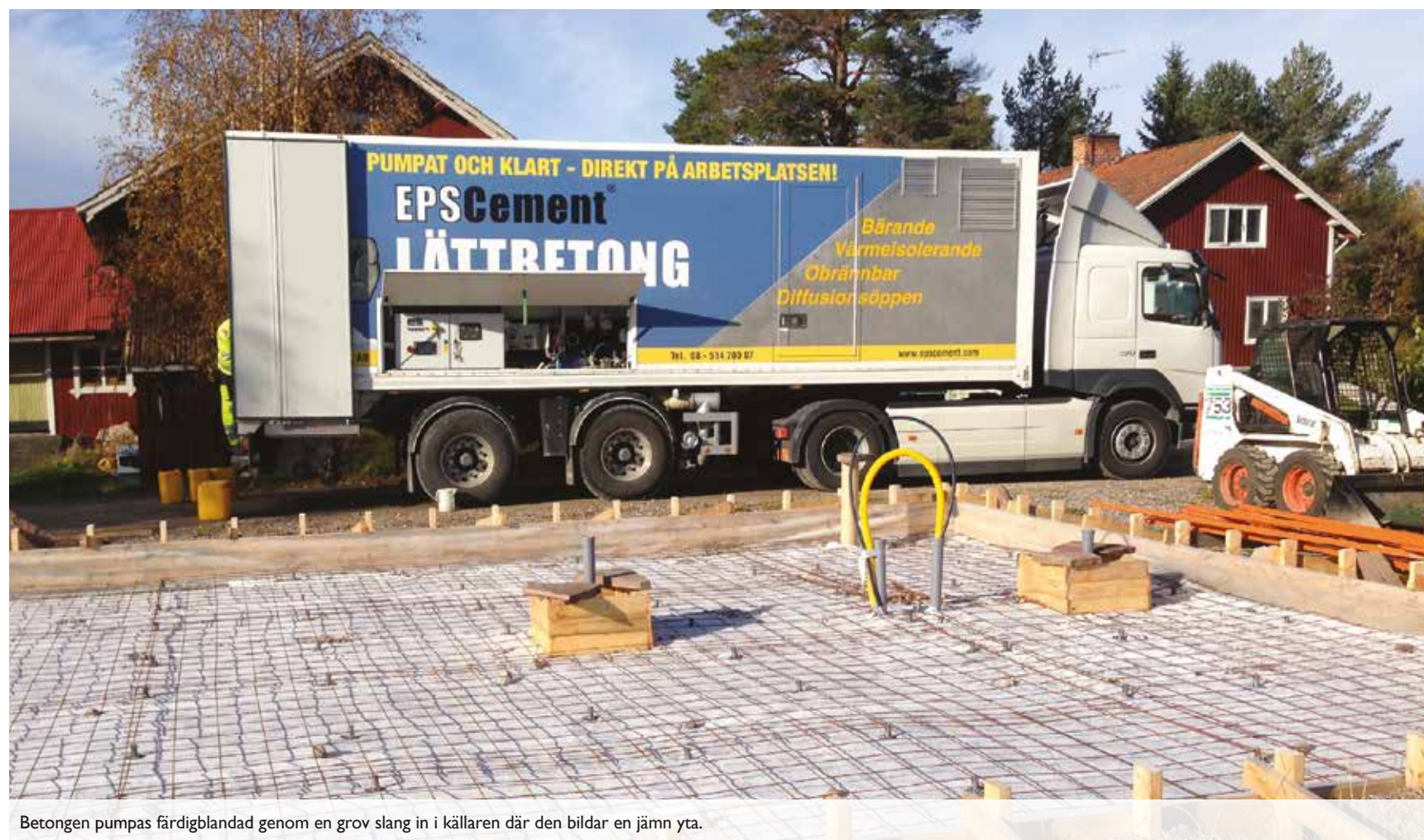
Betongen pumpas färdigblandad genom en grov slang in i källaren där den bildar en jämn yta.