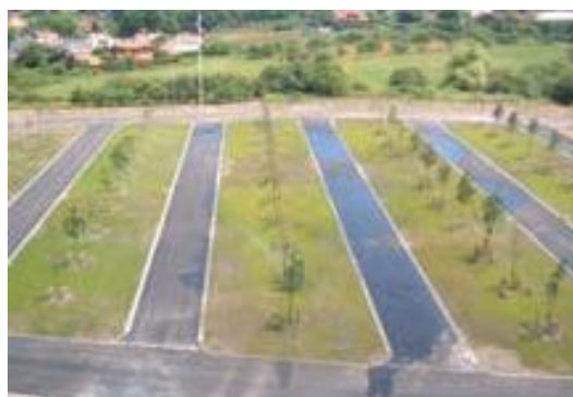
Gravel Cell® förstärkning och uppbyggnad används här för infartsvägarna och Turf Cell® förstärkning och uppbyggnad används till parkeringsplatserna.