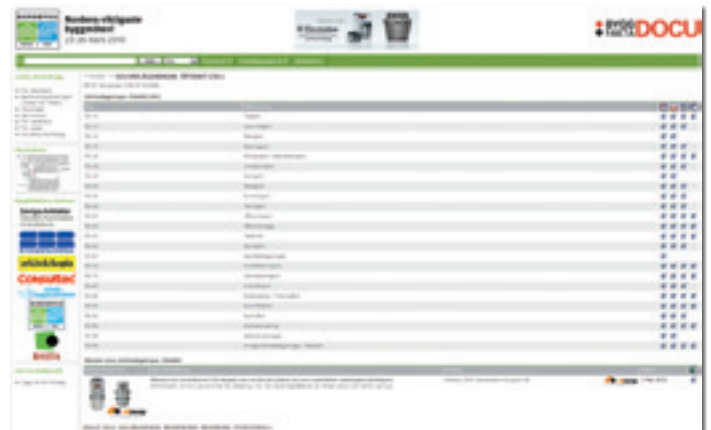
Redan nu finns alla utställare på http://nordbygg.byggfaktadocu.se .